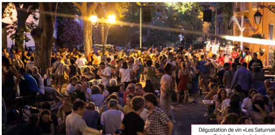
Dégustation de vin «Les Saturnales» - Saint-Saturnin de Lucian

Cet engagement bénévole, vital pour le festival, permet de soutenir les professionnels. L'association a embauché en 2016, deux salariés fixes (Production et communication) ainsi que des techniciens du spectacle pour la technique.