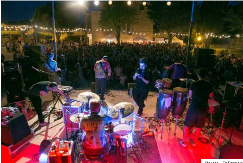
Bareto - St Pargoire