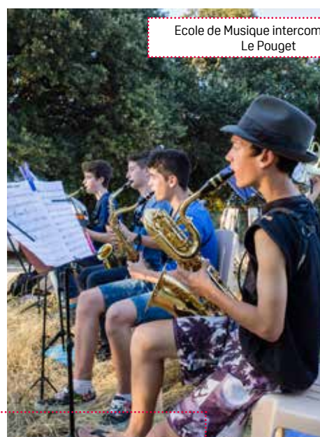
Ecole de Musique intercommunale Le Pouget

Cette année, le festival a également accueilli une association humanitaire qui œuvre pour la scolarisation en Afrique, une association locale pour le développement de la musique à Saint Pargoire et l'école de musique intercommunale.