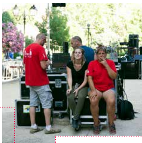
Bénévoles - Saint-Saturnin de Lucian