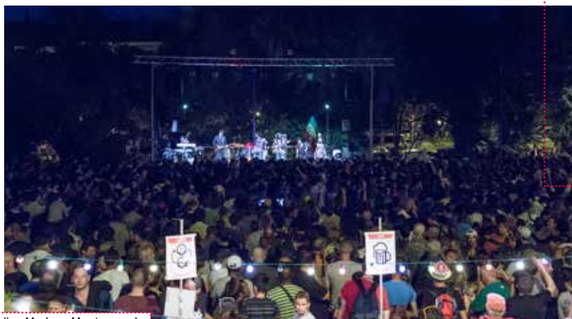
Julian Marley - Montarnaud

Au-delà des artistes confirmés, les Nuits Couleurs sont une référence pour les groupes locaux , avec plus de deux cents demandes de programmation d'artistes du Languedoc-Roussillon. L'association défend également la création locale en rémunérant tous les musiciens locaux avec un cachet minimum pour chacun. Cette politique est fondamentale pour l'émergence d'une nouvelle scène artistique professionnelle et la sécurisation de leur statut intermittent.